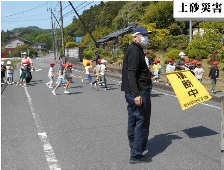
土砂災害想定避難訓練