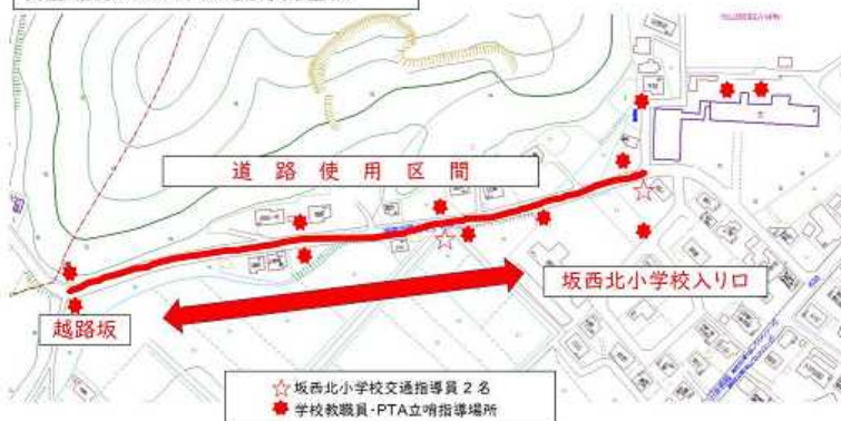
坂西北小マラソン大会 安全確保のための人員等配置図